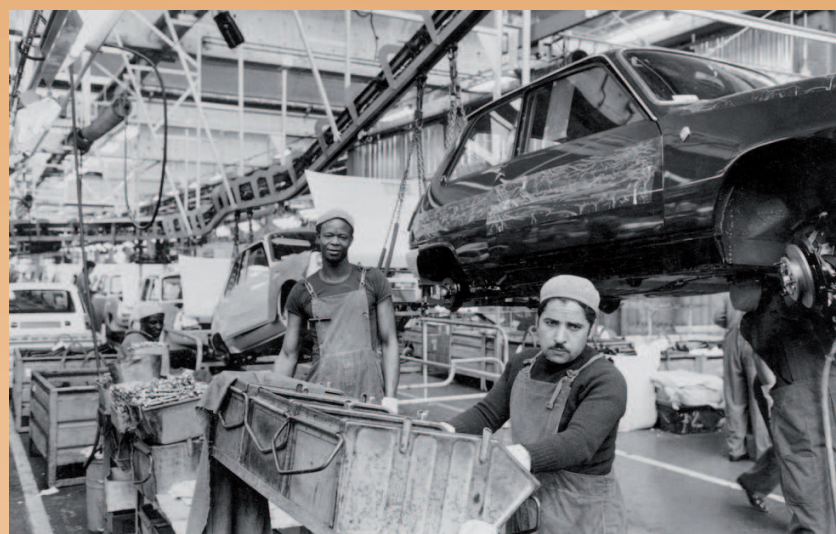
Chaîne de montage, usine Renault de Flins 1975 (Cité Nationale de l'histoire de l'immigration)