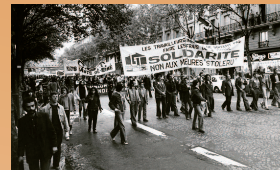
Manifestation à Paris : «les travailleurs ne doivent pas faire les frais de la crise»

Aujourd'hui avec une crise de la société qui dure et alimente précarité, chômage, exclusion et pauvreté, le pouvoir, avec le relais d'une forte médiatisation, rejettent les difficultés sur ces populations. Pourtant, ces enfants d'immigrés, majoritairement nés sur le territoire, constituaient déjà une part de la population française.